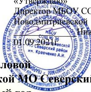
График работы столовой МБОУ СОШ № 36ст. Новодмитриевской МО Северский район на 2021-2022 учебный год